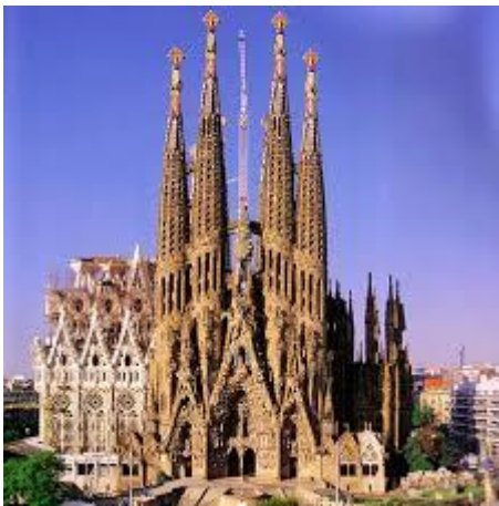
La Sagrada Família

Antoni Gaudi (1852-1926) est un architecte espagnol. De nombreuses œuvres de cet architecte sont visibles à Barcelone.